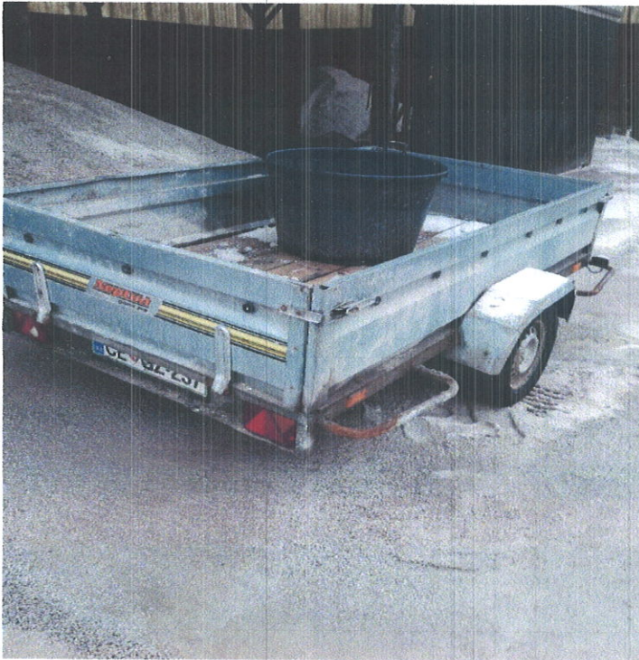
Slika 2: Avtomobilska prikolica